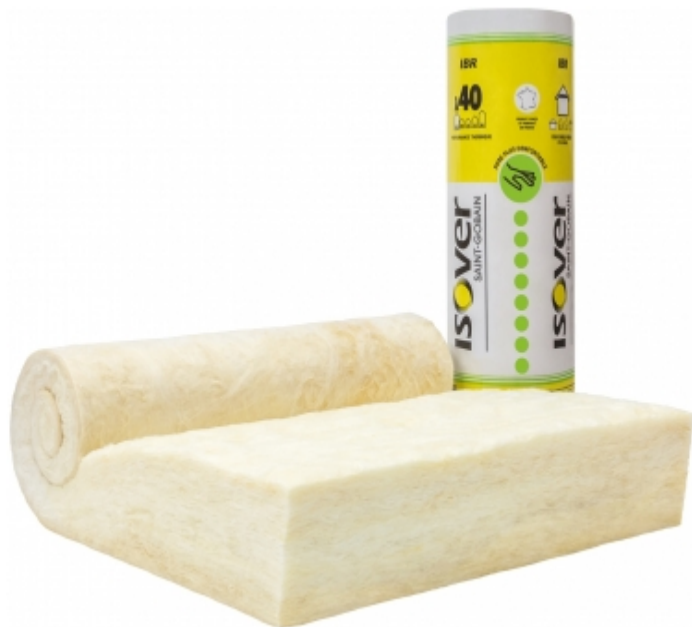
Rouleau en laine de verre sans revêtement