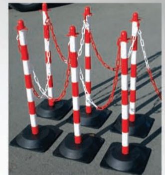
Avec poteaux ref. 53 03 01