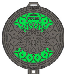
Segment supérieur + inférieur