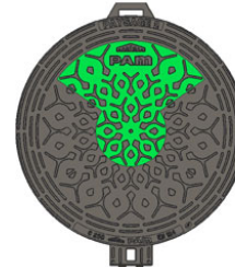
Segment supérieur + central