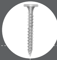
Vis ROC 25 ou 35 mm