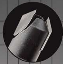
FRAISOIR CARBURE 45°