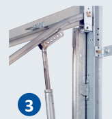
3 Bras tubulaire et vérin à ressort