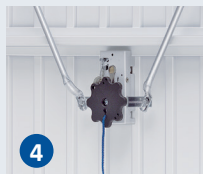
4 Garniture (poignée extérieure + poignée intérieure) Serrure avec cylindre profilé + pènes