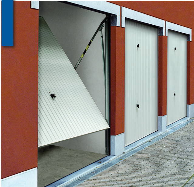
Porte basculante motif 114 - RAL 9016

Porte prémontée non motorisable avec cadre dormant en acier galvanisé tubulaire sur 3 côtés sans barre de seuil.