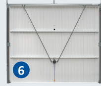
6 Panneau (bardage rainures + 2 renforts + cadre tubulaire)