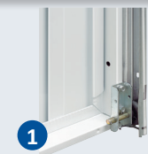
1 Pattes de fixation supérieures et inférieures

Porte recommandée dans le cadre d'un linteau cintré ou d'une pose en bordure de voie publique.