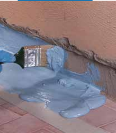
Application au pinceau, de Mapelastic AquaDefense à la jonction sol/mur, avant l'application de Mapeband PE 120