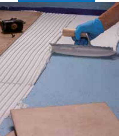
Collage des carreaux sur Mapelastic AquaDefense