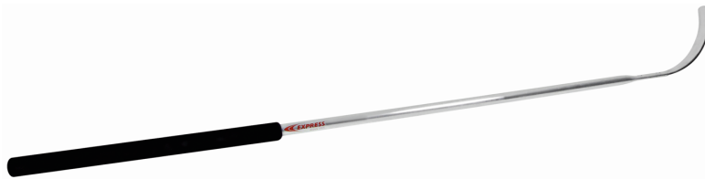
Canne d'étancheur fixe Réf. 32708