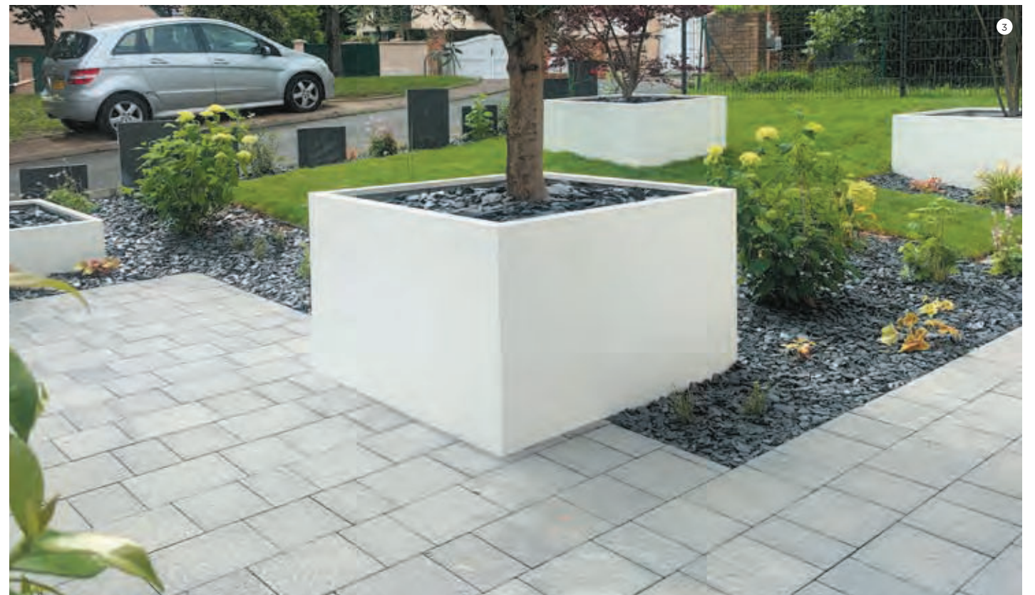
1 2 3 Pavé Navarre, finition brut, teinte Gris nuancé