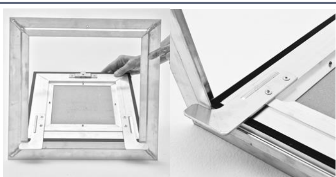
Gros plan sur patte de retenue