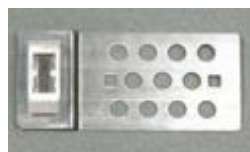
Aimant force portante 2.5 Kg

4 pattes aimantées à placer sur le support de l'habillage de baignoire. A coller ou à visser